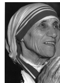
Beata Teresa de Calcutta

Ritiro Internazionale presso il Santuario della Madonna di Czestochowa (Polonia) per Sacerdoti e Seminaristi dal 25 al 30 giugno 2012