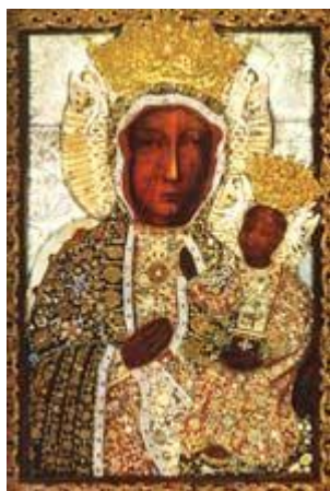
Nostra Signora di Czestochowa "La Madonna Nera"

Saint Barbara Street, No. 41 42-200 Czestochowa Tel. 034 365-12-15