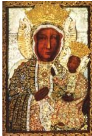
Nuestra Señora de Czestochowa "La Virgen Negra"

Dirección: Saint Barbara Street, No. 41 42-200 Czestochowa Tel. 034 365-12-15