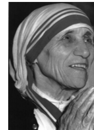
Beata Teresa de Calcuta

Retiro Internacional en el Santuario de Nuestra Señora de Czestochowa (Polonia) para Sacerdotes y Seminaristas 25 al 30 de Junio, 2012